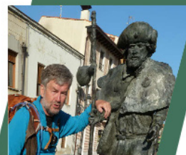
Thema: Die Zehn Gebote des Pilgers kennen lernen